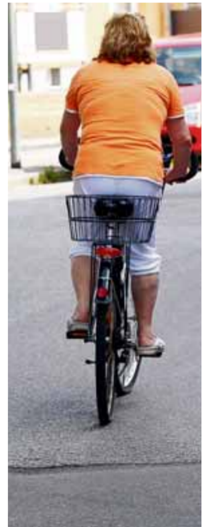
Eine Leserin beklagt den schlechten Zustand der Elisabethstraße in Lechhausen. Insbesondere für Radler sei die Holierpiste eine Herausforderung.

„Mir liegen keine Anträge bezüglich einer Urnenmauer auf dem Alten Ostfriedhof vor“, so der Umweltreferent, der darauf hinweist, dass es auf dem Friedhof die Möglichkeit von Urnenbestattungen gebe. „Es gibt Planungen für ein neues Grabfeld, auf dem dann auch wieder Bestattungsmöglichkeiten für Urnen vorgesehen sein könnten“, so Schaal. Dies sei für kommendes Jahr geplant. Eine Urnenmauer werde es aber auch dann nicht geben. „Sie sind absolut nicht mehr zeitgemäß“, so Schaal, der erklärt, dass bei Bedarf auf Urnenstellen zurückgegriffen wird, weil diese flexibler zu handhaben seien.